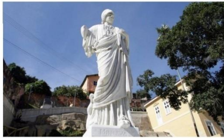
Valongo. Jandira Suspensos, região reúne beleza e história da escravidão no Rio.

RIO — Onde hoje está o Largo de São Francisco da Prainha funcionou um movimentado mercado de venda de escravos da região do Valongo, retratado num quadro do artista alemão Johann Moritz Rugendas, na década de 1820. No Largo João da Baiana, na Pedra do Sal, onde hoje acontecem animadas rodas de samba, nasceu o gênero musical nas primeiras décadas do século XX. Mais adiante, na Baía de São Félix, foi aberta, na mesma época, uma das mais representativas associações carnavalescas, a Chora na Macumba.