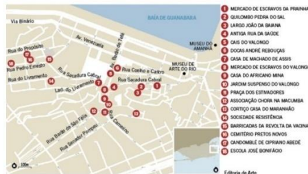
A nova Pequena África - Editora de Arte

O aplicativo também dá acesso a fotos antigas e reproduções de pinturas com cenas de escravos no Rio, além de mostrar a primeira casa de Machado de Assis, na Ladeira do Livramento, e a Casa do Africano Mina, na Rua Camerino, liderança religiosa negra do século XIX.