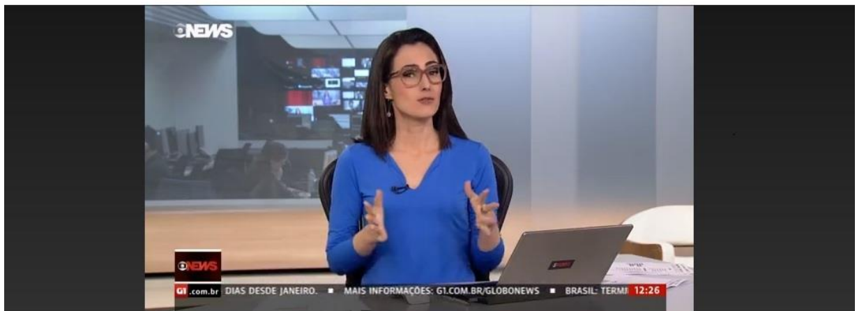
Link ao vivo exibido no Jornal GloboNews - 2/4