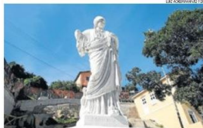
Valongo. Jardins Suspensos: região reúne beleza e história da escravidão no Rio